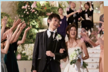
グランドホテル浜松 2組様

結婚を決められたおふたりへ! 結婚式をまだ挙げていないおふたりへ! NPO法人はま婚!と協賛結婚式場からの “結婚式応援”キャンペーン!