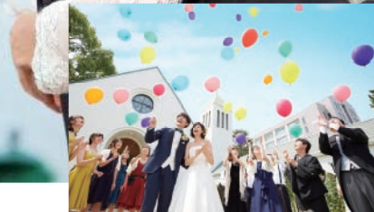
つま恋リゾート彩の郷 2組様