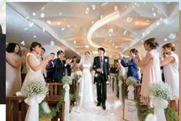
ホテルクラウンパレス浜松 2組様